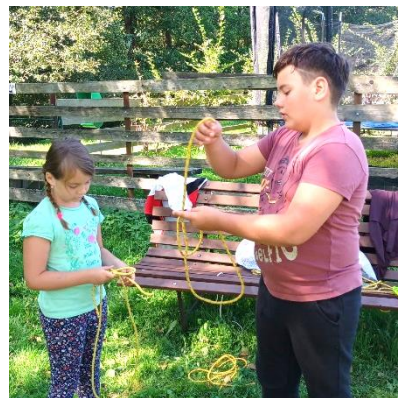
Uzlujeme a pomáháme si

prakticky trávily veškerý volný čas. Počasí nám přálo a tak jsme si celé soustředění pořádně užili, včetně večerní grilovačky a pozorování