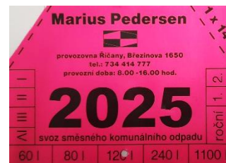
Vzhled budoucí známky

upřesníme postup mobil- ním rozhlasem a na webu. Předpokládáme, že praxe též napoví.